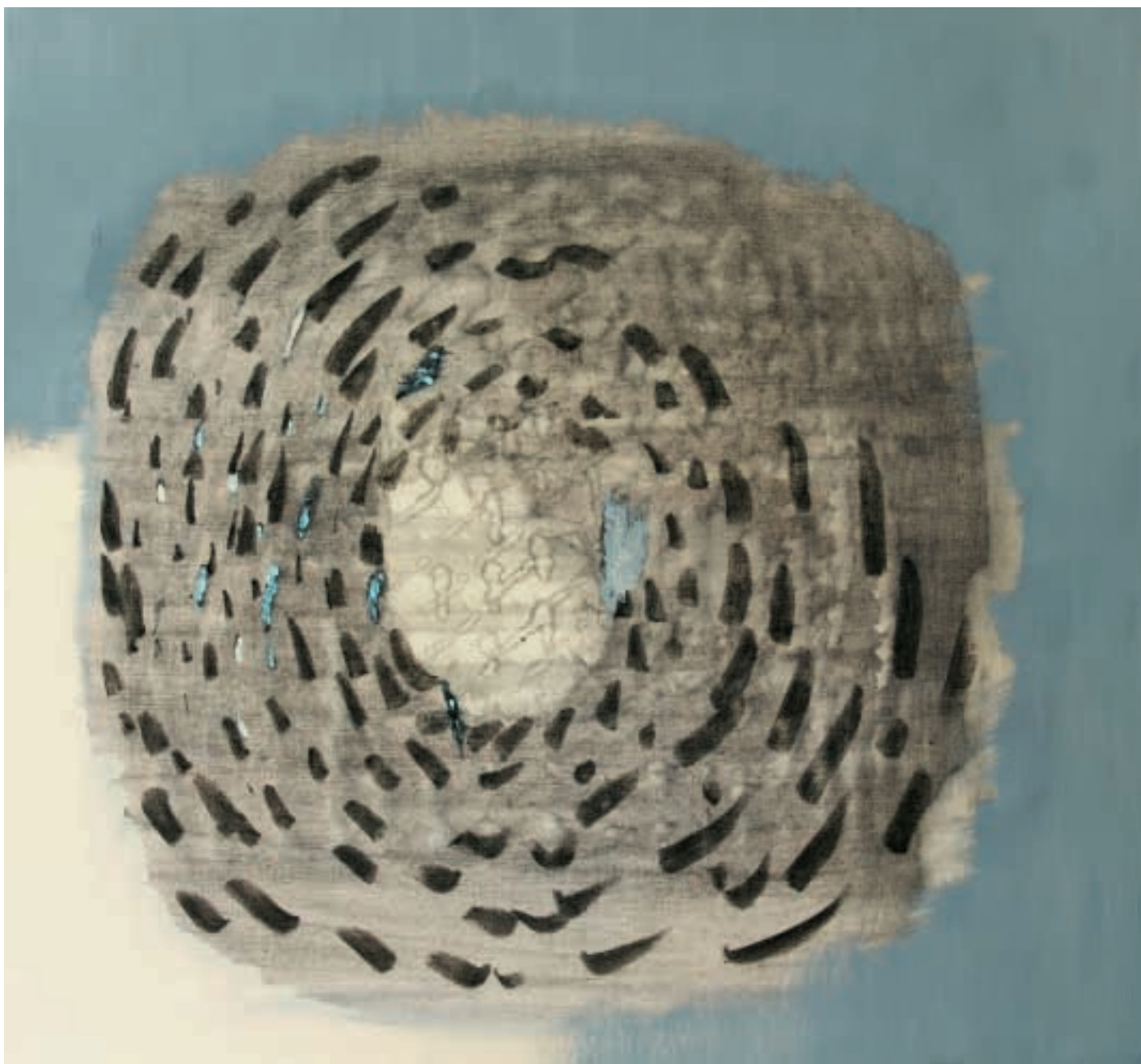
Dav I. / Folla I. / Crowd I. / olej a kombinované techniky na plátně