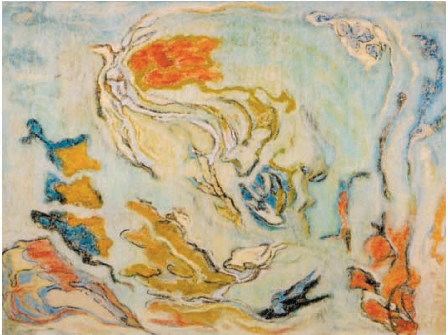
Try to catch me / 1996 / pastel