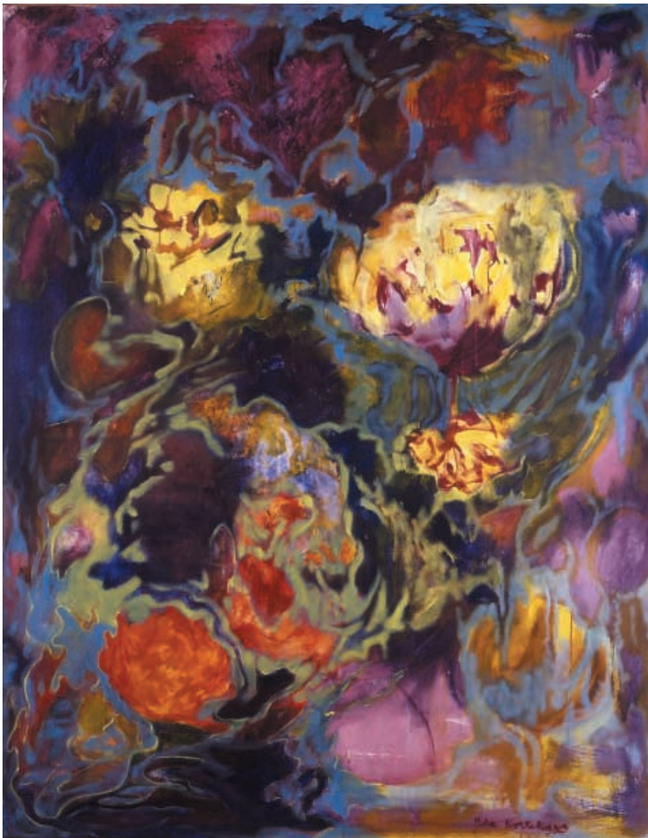
Baroko / Barocco / Baroque / olej na plátně