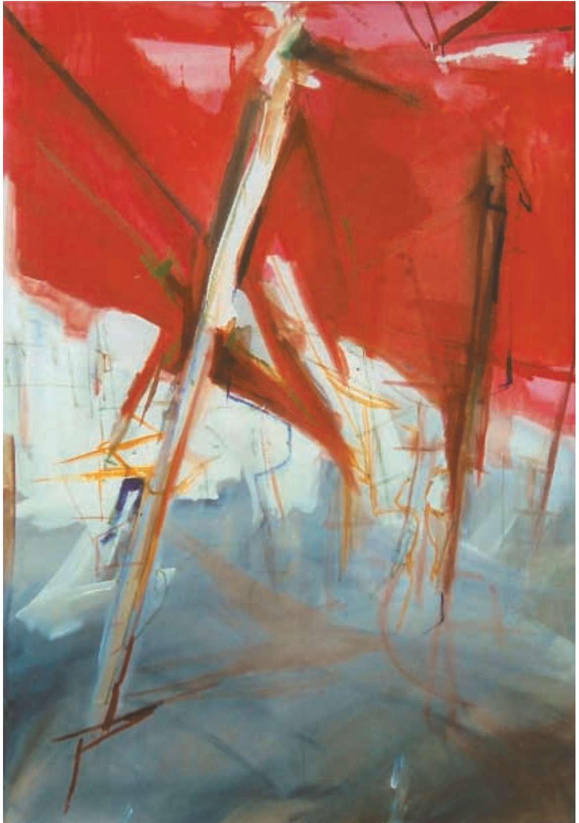
La Paz in Blaricum / olej