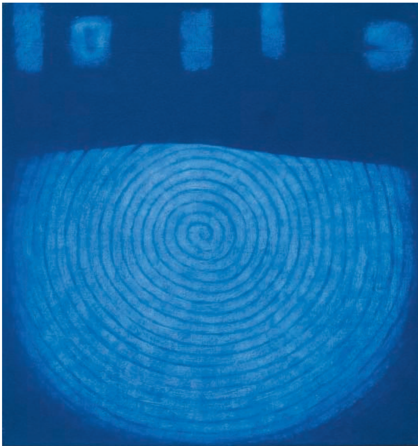
Slavnosti v amfiteátru / Feste nell' Amfiteatro / Celebrations / olej na plátně