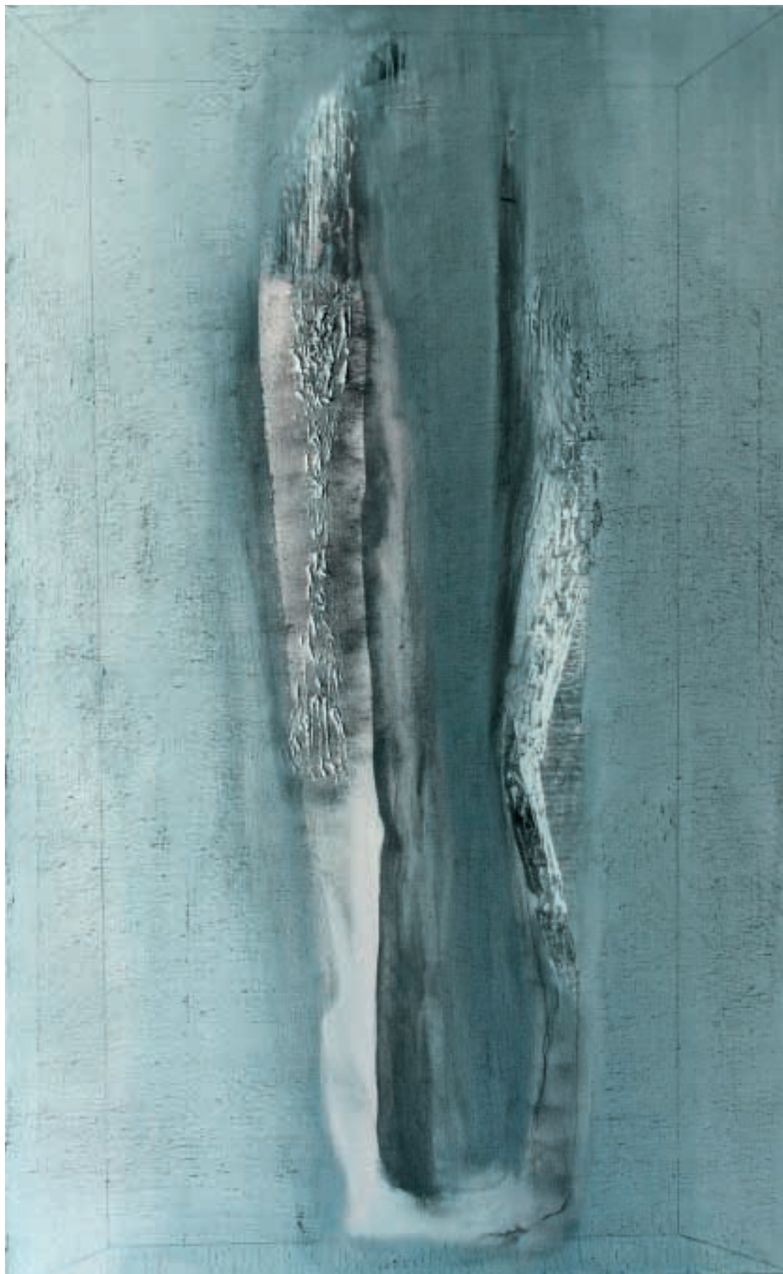
Alter ego / olej a kombinované techniky na plátně