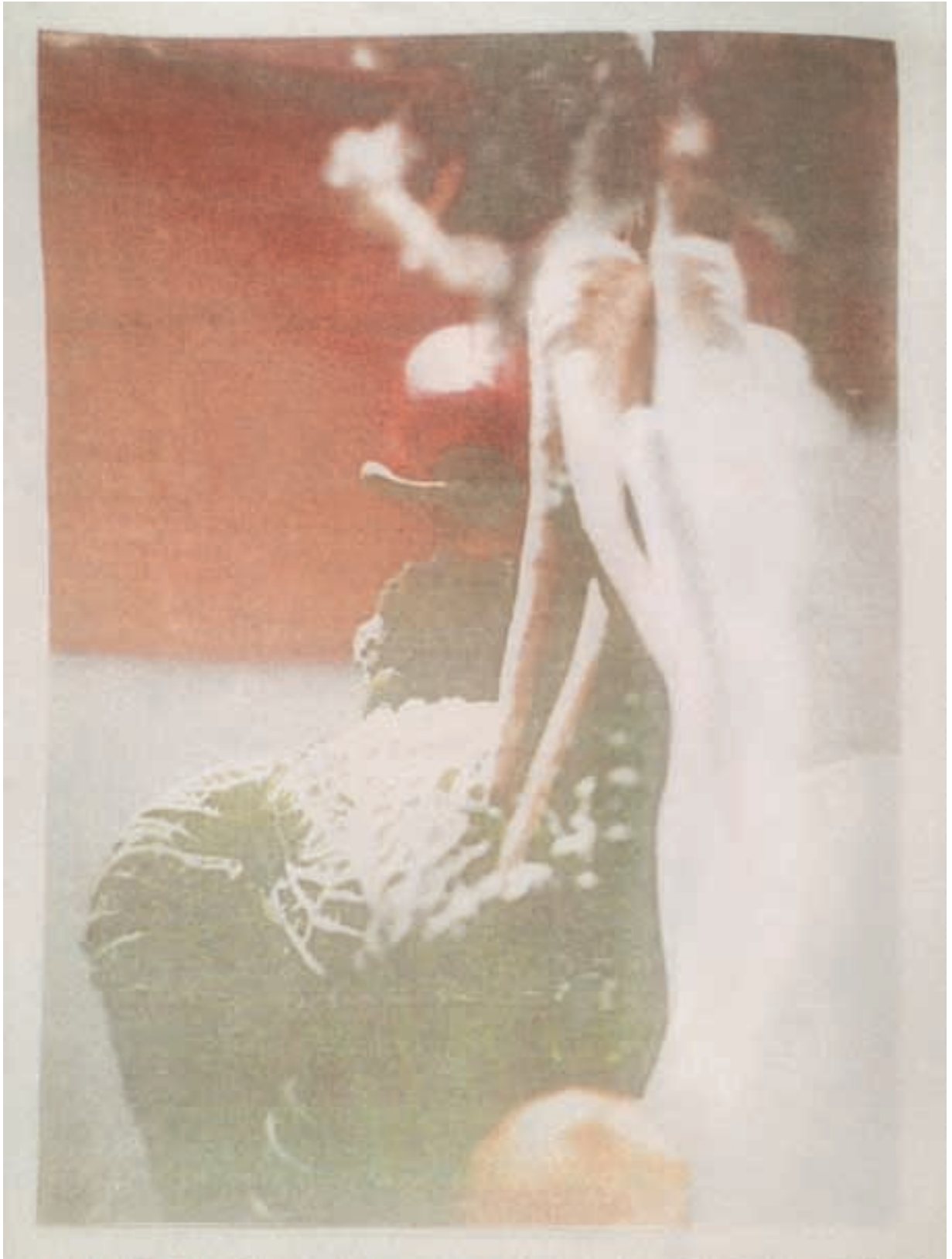
Studie II. / autorský fotomontyp