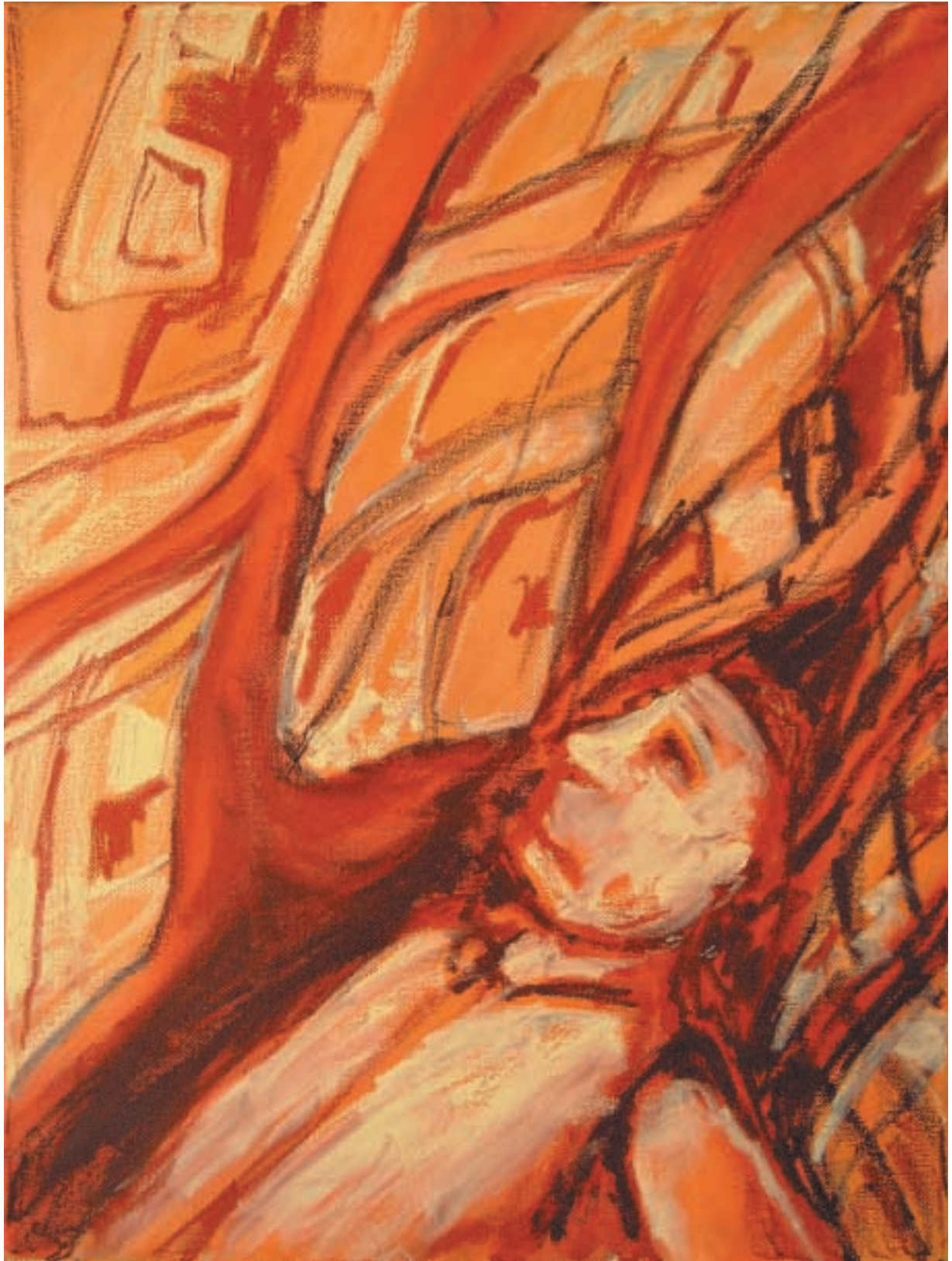
Výšky / Alteze / Heights