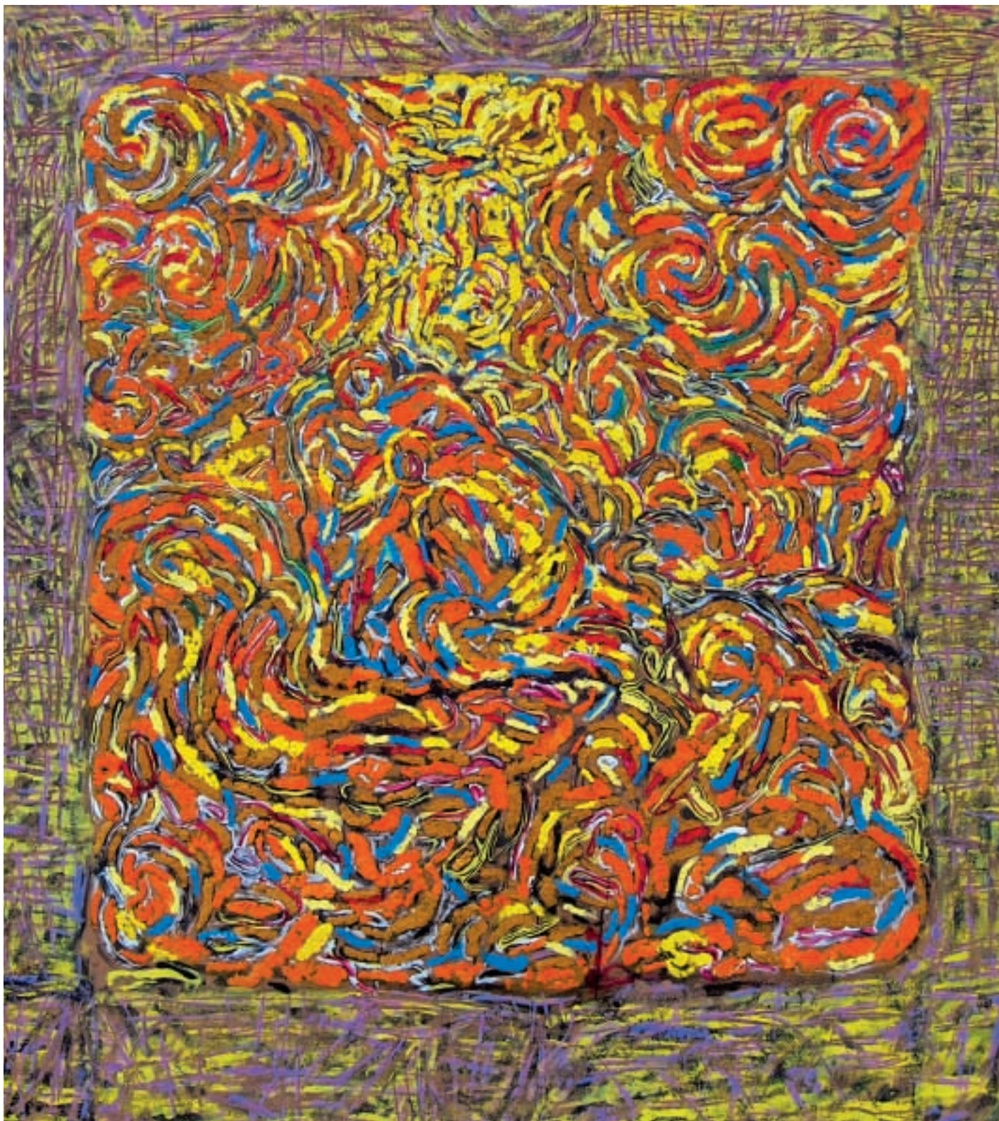
Křest / Battesimo / Baptism / kombinované techniky na sololitu