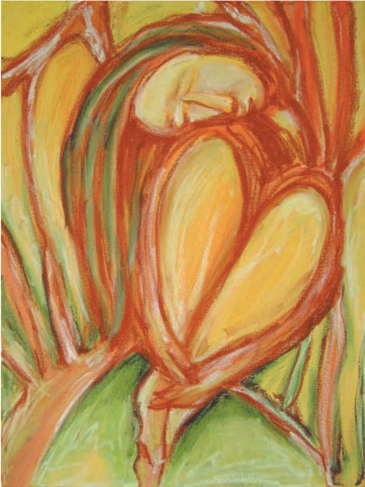
Dívka v parku / Ragazza nel Parco / Girl In Park