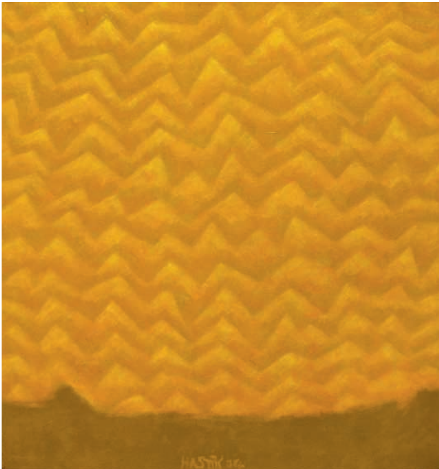
Slavnost / Festa / Celebration / olej na plátně