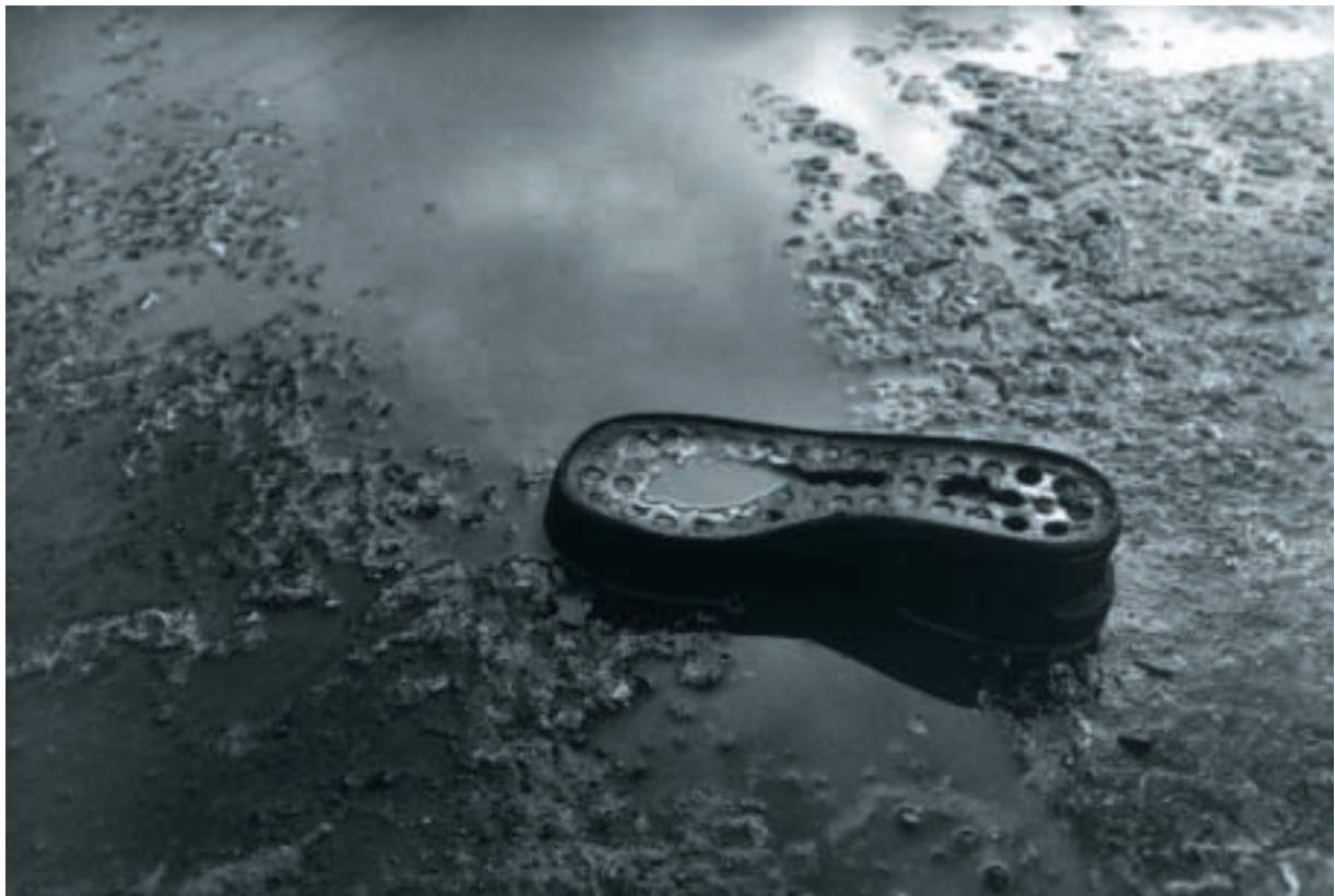
Olomouc I. - IV. / fotografie