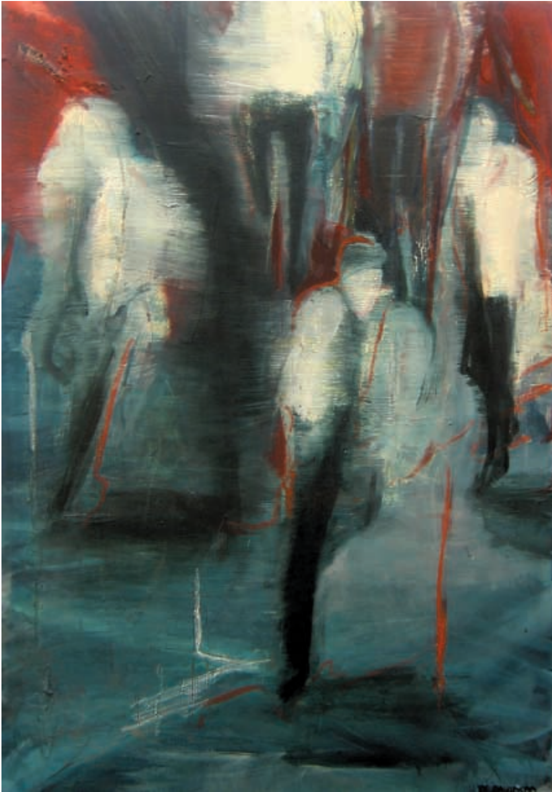
Okamžiky / Momenti / Moments / olej