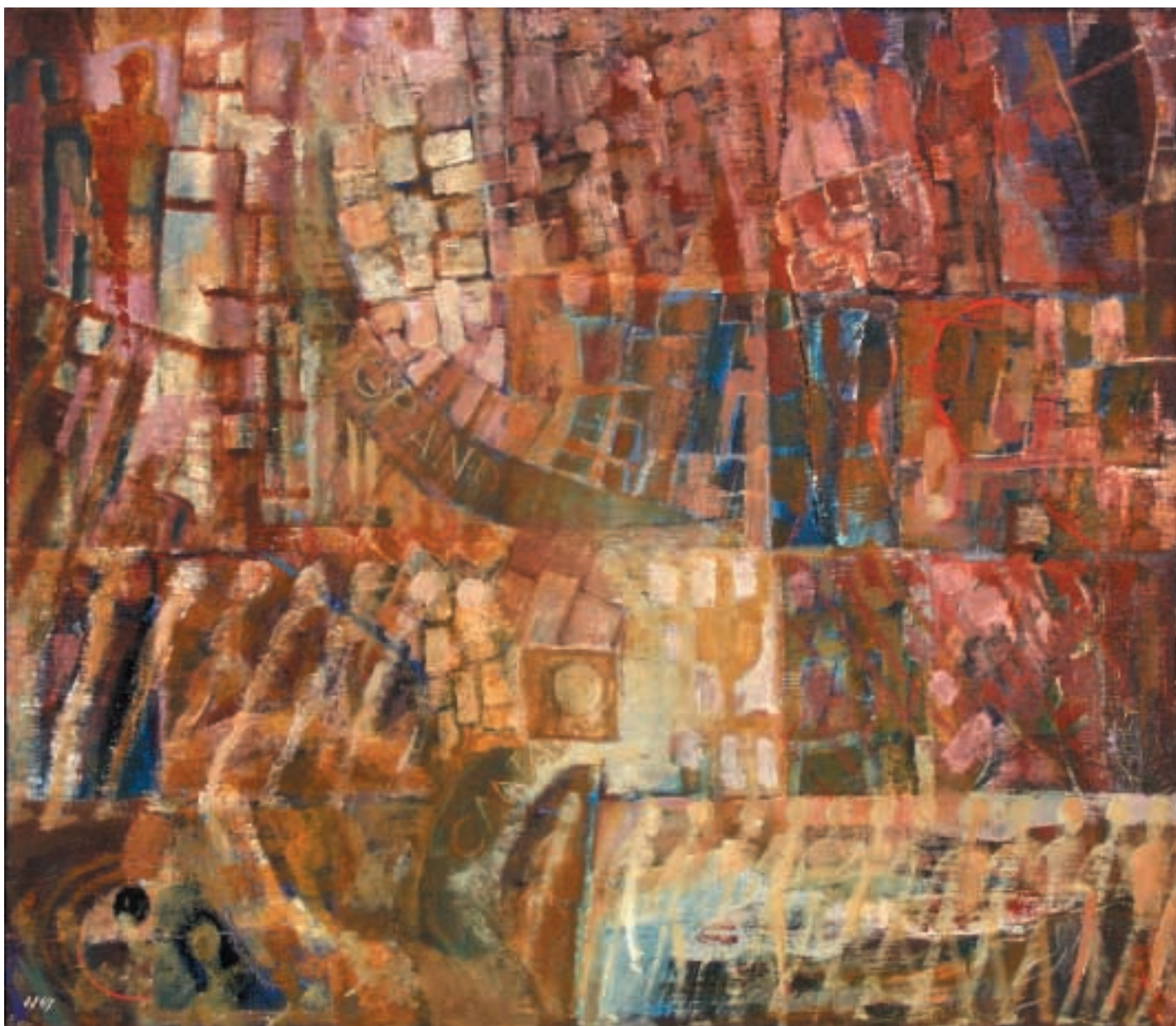
Venezia - vzpomínka na rok 1968 I. / olej