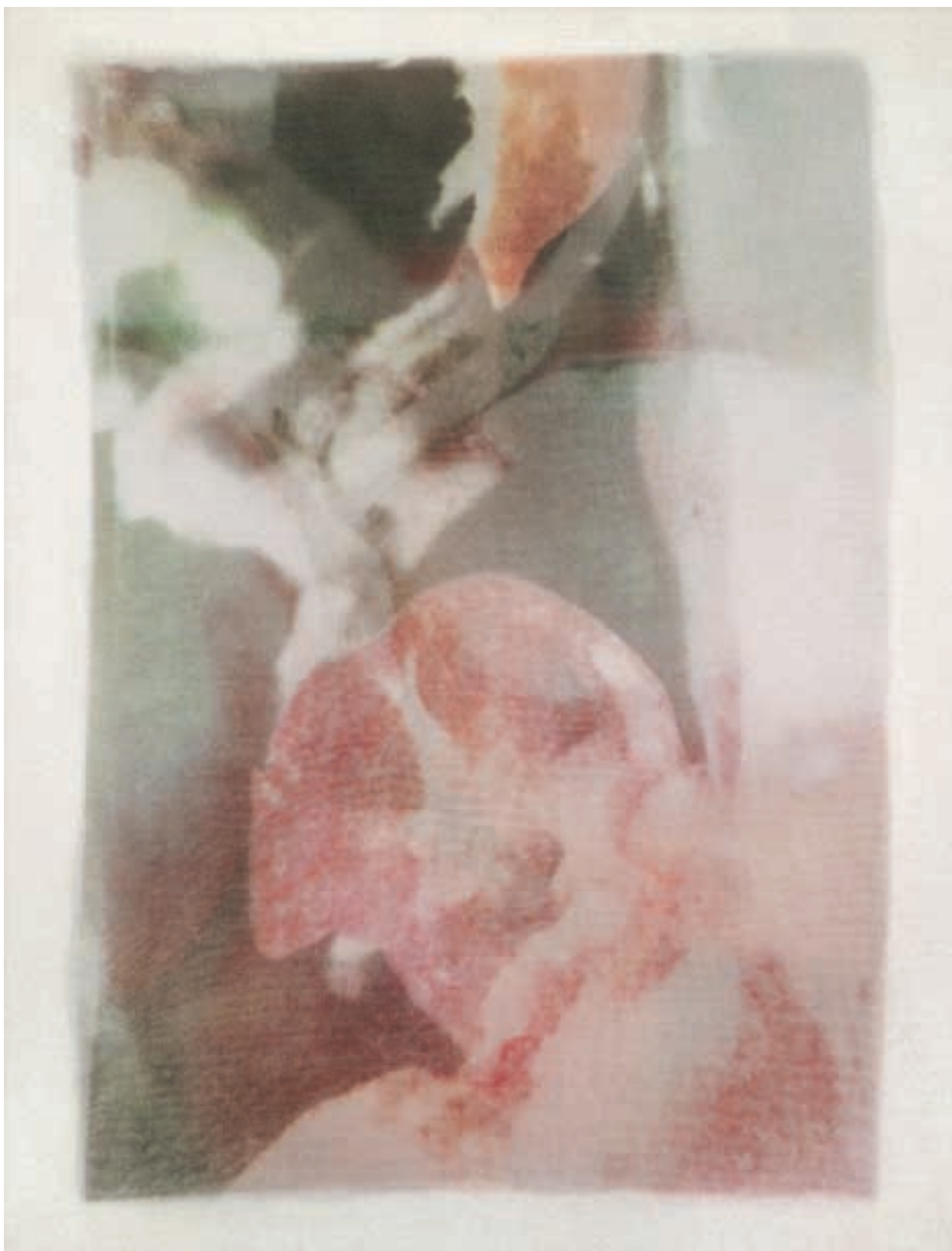
Studie I. / autorský fotomontyp